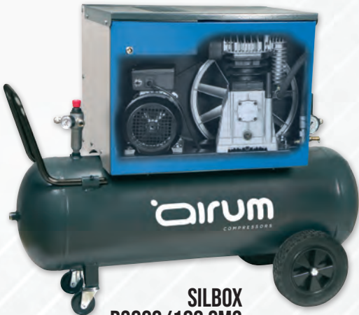
SILBOX B3800/100 CM3 AIRUM

3 hp caldera 100 lts. 390 lts./min. 220V II 10 bar. 69 dB(A).