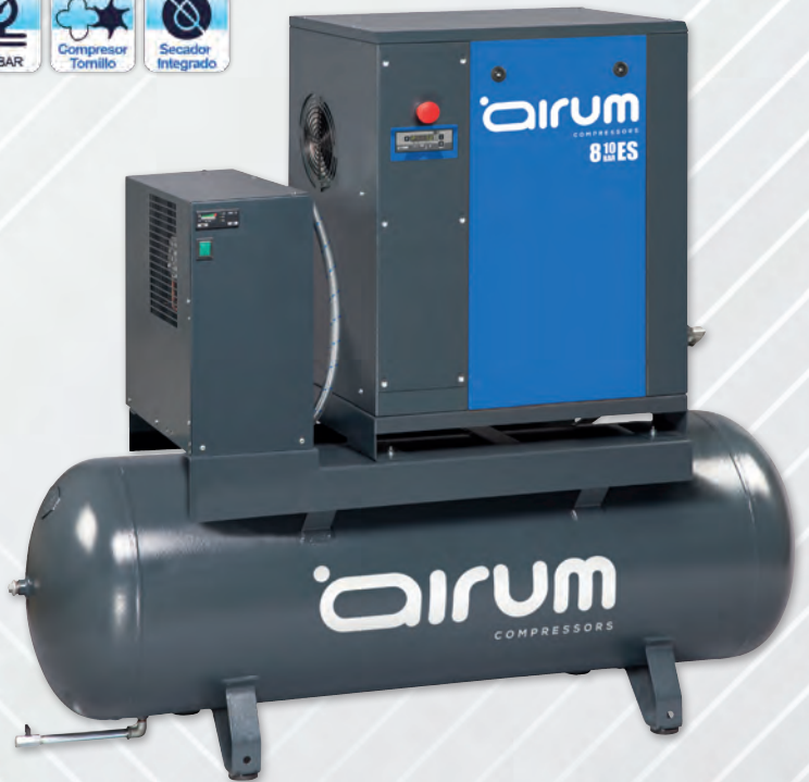
DBS 5.5-10-270 ES AIRUM

7.5 Hp caldera 270 lts. 650 lts./min. 400V III 10 bar. 64 dB(A)