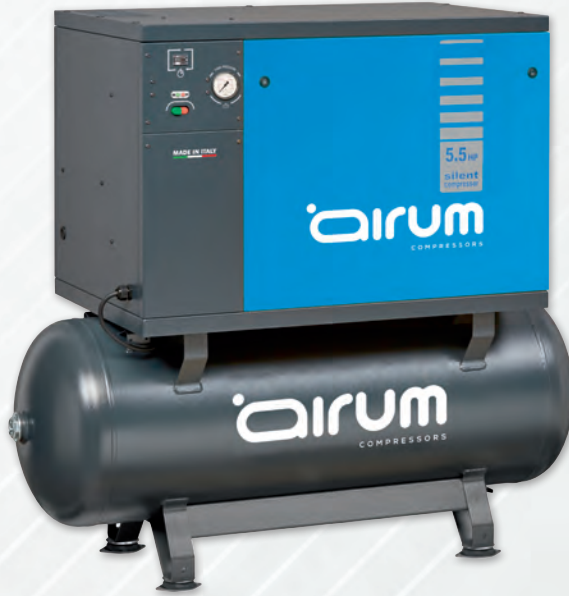
AIRSIL2 NB5/5.5FT/270 AIRUM

5.5 hp caldera 270 lts. 640 lts./min. 400V III 11 bar. 70 dB(A).