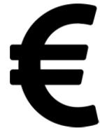
Compra-venta de CAE

*Condiciones sujetas a estudio, valoración y aprobación por parte del sujeto obligado.