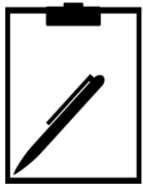
Pedido oficial Firma del Convenio CAE